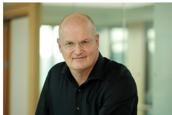
Dr. Matthias Huff Redakteur, KiKA

Der Junior ESC 2020 fand wegen der Pandemie ohne Künstler*innen, Delegationen und ohne Publikum in Warschau statt. Dieses Jahr ist Deutschland erst zum zweiten Mal mit dabei. Wie sieht es mit der Planung für die Junior ESC-Show am 19. Dezember in Paris aus?